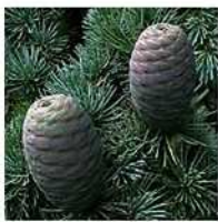
HE Cèdre de l'Atlas