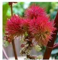
Huile de Ricin