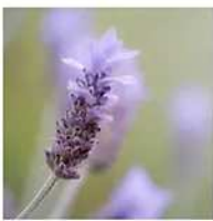
HE Lavandin Super