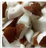
Huile de Coco